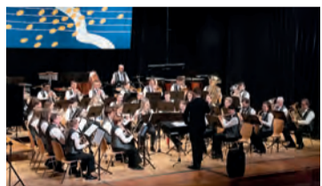
Im 1. Konzertteil ging es noch ruhig zu und her...

Nach dem klassischen ersten Teil, drehte nach der Pause die Rockband bROCKo.li die Regler auf und heizten