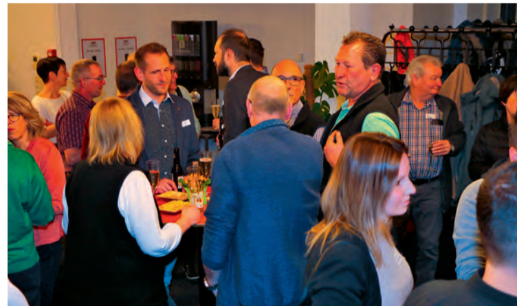
Der Austausch beim Apéro vor der HV wurde rege genutzt.