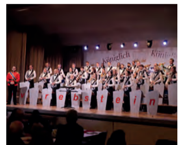
Der Musikverein Rebstein beim Schlussgesang im Progy.