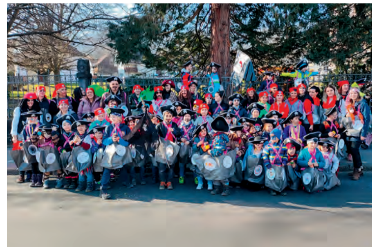
Rund 75 Kinder mit Eltern und Begleitpersonen bastelten für den Auftritt am Kinderumzug vom Schmutzigen Donnerstag.

Text: Simone Blatter