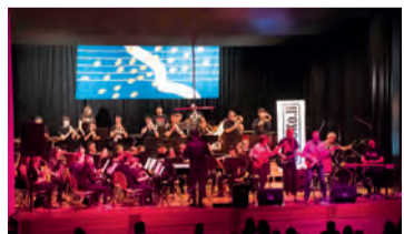
...nach der Pause rockte der MVM mit der Band bROCKo.li die Mehrzweckhalle Marbach.

die Stimmung in der Halle nochmals richtig ein. Zusammen mit der Jugendmusik unterstützte der Aktivverein die Band zu den grössten Rockklassikern aller Zeiten.