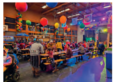
Der traditionelle Maskenball für Menschen mit Beeinträchtigung ging farbenfroh über die Bühne.