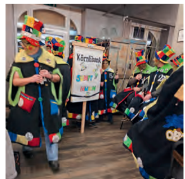
Die Körnlibank auf Tour durch die Rebsteiner Gastbetriebe.

Text: Lisa Rutz