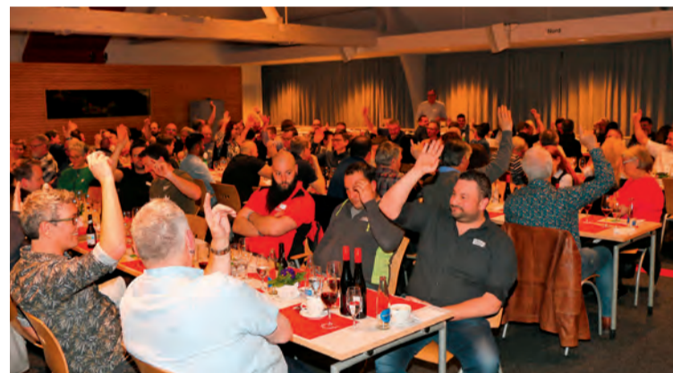
Die Versammlung nahm 10 neue Mitglieder in den Verein auf.

Text: Regula Schmid