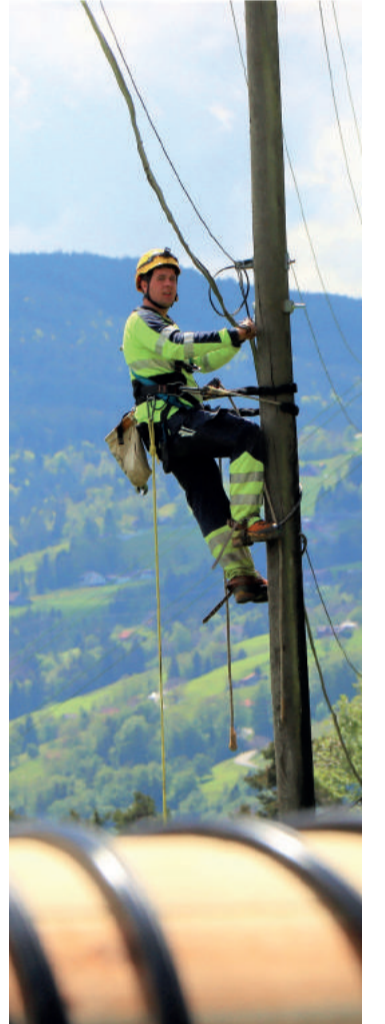
In den letzten vier Jahren wurden die verschiedenen Gebiete von Rebstein und Marbach an das Glasfasernetz angeschlossen. Der grösste Teil der Glasfasern konnten in bestehende Rohre eingeklebt werden. Ein kleiner Teil wurde über Freileitungen verlegt.