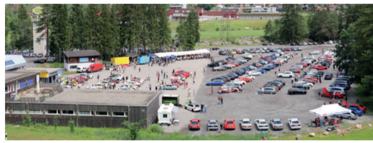
In Grösch (GR) organisiert der Audiclub Rheintal seit 10 Jahren ein Autotreffen.