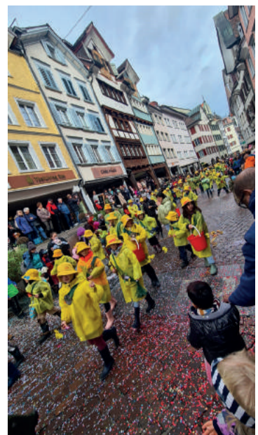
Rund 55 Kinder und über 20 Erwachsene haben mitgemacht!

Er ist aus dem Jahreskalender der Marper Chinderrundi nicht mehr wegzudenken. Der Kinderumzug am Schmodo in Altstätten ist jedes Jahr ein Highlight für die Kinder aus Marbach. Im Vorfeld wird gemeinsam voller Eifer das Kostüm gebastelt. Die Kinder werfen mit viel Freude Konfetti am Umzug und verteilen feine Süßigkeiten mit ihren langen Fischerruten. Zum Schluss wird bei der Fasnachtsparty im Festzelt der Rölleibutzen noch gefeiert, bevor die müden Fischer nach getaner Arbeit nach Marbach zurückkehren.