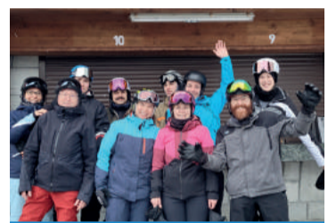
Konzert Musikverein Marbach

DO 6. Juni 2024, MZH Amtacker Vorbereitungskonzert Musikfest → musikvereinmarbach.ch