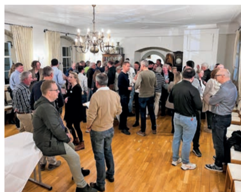
Zum Netzwerken und zur Eröffnung hat die Gemeinde Marbach ein Apéro spendiert.