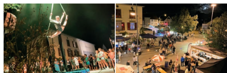
Auch im 2026 darf in Marbach in den Gassen wieder geturnt und gefestet werden.

Text: Sonja Galli Fotografie/Grafik: Sonja Galli