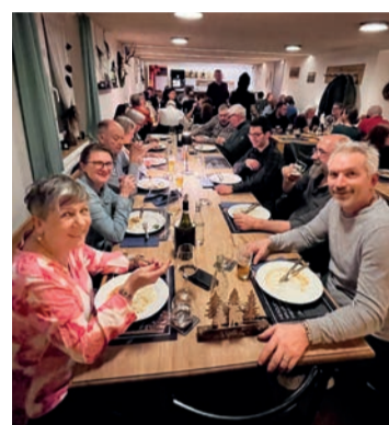
Zur Freude von Mitglied KreuzQuer, der Anlass war sehr beliebt.

Text: Regula Schmid