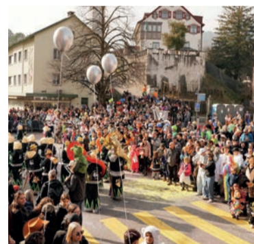
Viele Besucher genossen den Umzug und die Obervogelwahl von Mürs Langenegger.