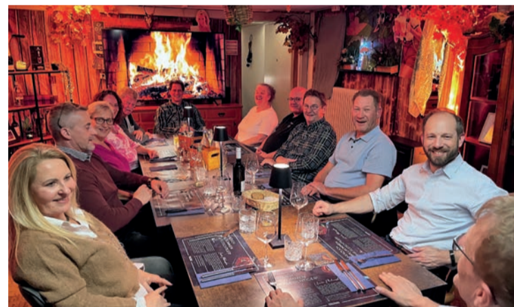
Eine gemischte Gesellschaft mit Marpern, Rübstern, Gwerblern, Pensionären und Politikern startete mit spannenden Gesprächen ins 2025.