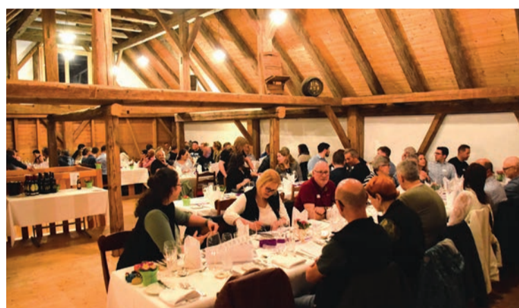
In der Schloss-Schür genossen die «Gwerbler» die HV und ein feines Abendessen.