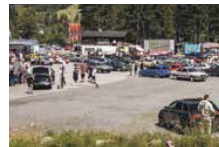
Das Festgelände mit der malerischen Landschaft lädt zum Verweilen und geniessen ein.

Grüşch-Danusa statt. Zu sehen gibt es alle Arten von Fahrzeugen – von liebevoll gepflegten Oldtimern über Rennfahrzeuge bis hin zu ganz normalen Dailys. Ein besonderes Highlight ist