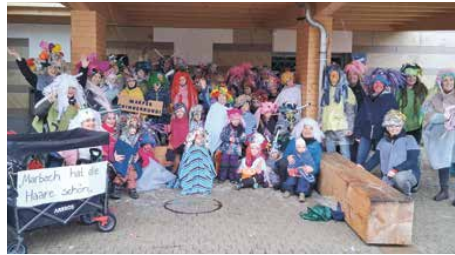
Mit ihren extravaganten Perücken brachte die Chinderrundi Farbe ins graue Wetter.

Die Marper Chinderrundi freute sich über viele fasnachtsfreudige Kinder und Begleitpersonen und schmiedet wohl schon erste Ideen für die nächste närrische Saison.