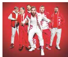
Die «Stubete Gäng» wird auf der Rebsteiner Birkenau für Stimmung sorgen.

Tickets für dieses Highlight sind im Vorverkauf bereits zu ergattern (eventfrog.ch/stubetegaeng-pokalturnier).