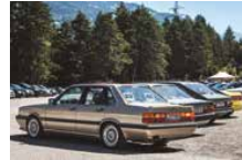
Von Oldtimern bis Dailys – da ist für alle etwas dabei.

Am Wochenende vom 27. und 28. Juni 2026 wird Grüşch erneut zum Treffpunkt für Fahrzeugbegeisterte aus nah und fern. Der Audiclub Rheintal lädt zu seinem traditionellen Auditreffen ein, das seit über einem Jahrzehnt hunderte Besucherinnen und Besucher anzieht. Der Samstag steht ganz im Zeichen des gemeinsamen Erlebens. Die Teilnehmerinnen und Teilnehmer starten zu einer Ausfahrt durch die wunderschöne Landschaft Graubündens, vorbei an eindrucksvollen Tälern und malerischen Dörfern. Zur Mittagszeit wartet ein besonderes Highlight: ein leckeres 3-Gänge-Menü, das den ersten Tag des Treffens kulinarisch abrundet. Den Abend werden wir gemütlich auf dem Festgelände ausklingen lassen. Am Sonntag findet das grösste Auditreffen der Schweiz auf dem Veranstaltungsgelände der Bergbahnen der Sonderplatz, auf dem Fahrzeuge bis Jahrgang 1978 präsentiert werden. Der Eintritt ist kostenlos, und jeder ist bei uns herzlich willkommen. Besucherinnen und Besucher, die mit einem Audi anreisen, dürfen ihr Fahrzeug gerne direkt auf dem Platz präsentieren. Für alle anderen Gäste steht ein Besucherparkplatz zur Verfügung. Der Audiclub Rheintal freut sich auf ein vielfältiges, lebendiges Wochenende und viele spannende Begegnungen.