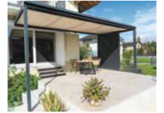
Beispiel einer Cover-Verglasung.

folglich als selbstständiger Geschäftsführer weiter. Die Nähe zum Ursprung bleibt, denn Infrastruktur und Erfahrung werden weiterhin gemeinsam genutzt – effizient und im Sinne der Kundschaft.