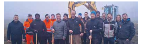
Regionale Handwerker sind mit viel Engagement und Fachwissen im Einsatz.