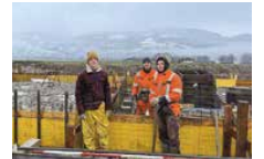
Bei jedem Wetter wird gearbeitet.