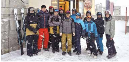
Trotz kräftigem Schnee nahm der MV Marbach viele schöne Erinnerungen mit nach Hause.

Am Wochenende vom 10. und 11. Januar verbrachte der Musikverein Marbach ein gelungenes Ski-Weekend in Davos. Die Teilnehmenden durften dabei ein echtes Wintererlebnis in den Bündner Bergen geniessen.